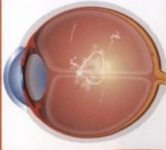
Weiss Ring Floater

Diese ringförmigen Floater sind relativ große, fasrige Floater die sich üblicherweise in sicherer Entfernung von der Linse und der Netzhaut des Auges befinden. Dadurch können diese Floater sicher und effektiv mit der Laser-Vitreolyse behandelt werden.